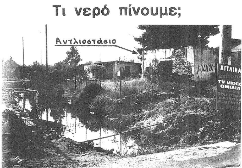
Αυτό είναι το Αντλιοστάσιο που μας τροφοδοτεί με νερό. Διακρίνονται τα βρωμόνερα και τα σκουπίδια.

Καταγγέλλουμε στους κατοίκους της περιοχής μας την απαράδεκτη και επικίνδυνη, για τη Δημόσια Υγεία, ενέργεια της Κοινότητας Νέας Μάκρης να βάλει ξανά σε λειτουργία το αντλιοστάσιο που βρίσκεται στη διασταύρωση των οδών Β. Ράτα και Αγίας Παρασκευής.