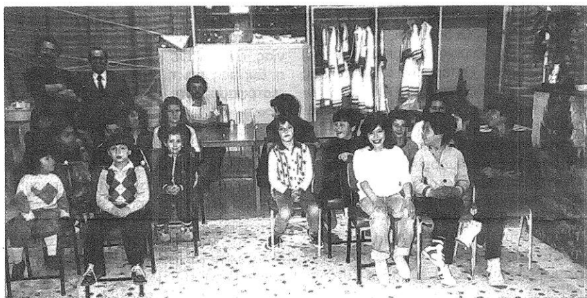
Μικροί μαθητές παρακολουθούν την πρώτη κινηματογραφική προβολή που έγινε στα γραφεία του Συλλόγου μας. Σήμερα ο αριθμός των παιδιών έχει πολλαπλασιαστεί.

Ο Επιμορφωτικός Σύλλογος άρχισε την προβολή κινηματογραφικών ταινιών με στόχο την ψυχαγωγία και Επιμόρφωση μας. Προς το παρόν οι προβολές γίνονται κάθε Παρασκευή στις 8.000 το βράδυ, στα γραφεία του Συλλόγου μας. Το τελικό πρόγραμμα και περιεχόμενο των Κινηματογραφικών Προβολών θα διαμορφωθεί ανάλογα με τις ανάγκες της περιοχής και τη βοήθεια που θα προσφέρουμε όλοι.