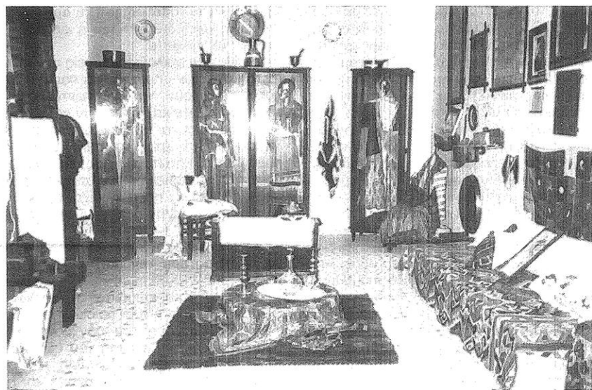
Χαρακτηριστική φωτογραφία του Μακρηνολιβιστιανού Λαογραφικού Μουσείου

Θύμισες παλές λησμονημένες, θαμμένες στα βάθη της καρδιάς μας βγαίνουν στην επιφάνεια μόλις αντικρύσουμε κάτι που να μας θυμίζει τη χαμένη μας πατρίδα.