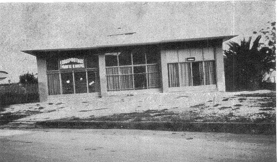
Το κτίριο που στεγάζει τα γραφεία του Ε.Σ.Ν.Μ. και το Λαογραφικό Μουσείο.

Ο Επιμορφωτικός Σύλλογος Νέας Μάκρης αγωνίζεται για το ανέβασμα του πολιτιστικού επιπέδου της περιοχής μας και την κοινωνική πρόοδο για τη δημιουργία Πολιτιστικού Κέντρου, την ανέγερση Λαογραφικού Μουσείου, για αθλητικές εγκαταστάσεις, Βιβλιοθήκη κλπ. Με τα λίγα οικονομικά μέσα που είχε και έχει και χωρίς τις υπεράνθρωπες προσπάθειες των μελών του κατόρθωσε να διατηρήσει τη Στέγη του, να στεγάσει το Λαογραφικό Μουσείο, να δημιουργήσει Δανειστική Βιβλιοθήκη και με τις δραστηριότητές του να βάλε τις βάσεις για ένα πιο δημιουργικό μέλλον.