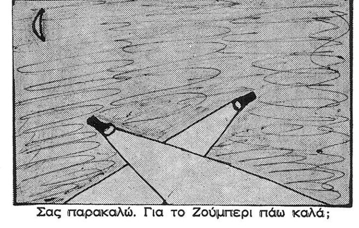
Σας παρακαλώ. Για το Ζούπερι πιάω καλά;

Υπεύθυνος σύμφωνα με το Νόμο Δ. Ι. ΚΑΡΓΑΣ οδός 106 αρ. 7 Επιστολές - Εμβάσματα: Ι. ΔΗΜΗΤΡΙΑΔΗΣ Επιμορφωτικός σύλλογος Ν. Μάκρης Τυπογραφείο: Γ. Λεοντακιανός Δ. Πλακεντίας 81 Χαλάνδρι